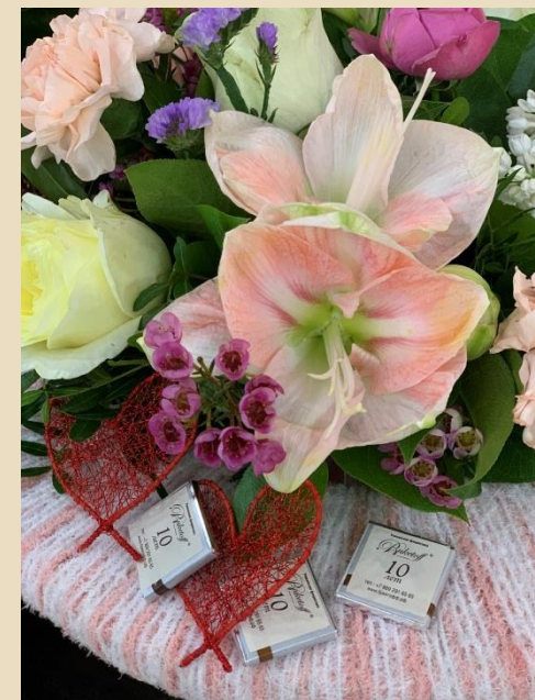
Букеты и композиции