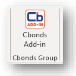
Рис. 1. Отображение надстройки на вкладке «Главная»

В результате в правой части окна откроется главная панель надстройки, на которой будет представлена форма авторизации и демонстрационная версия надстройки (рис. 2).